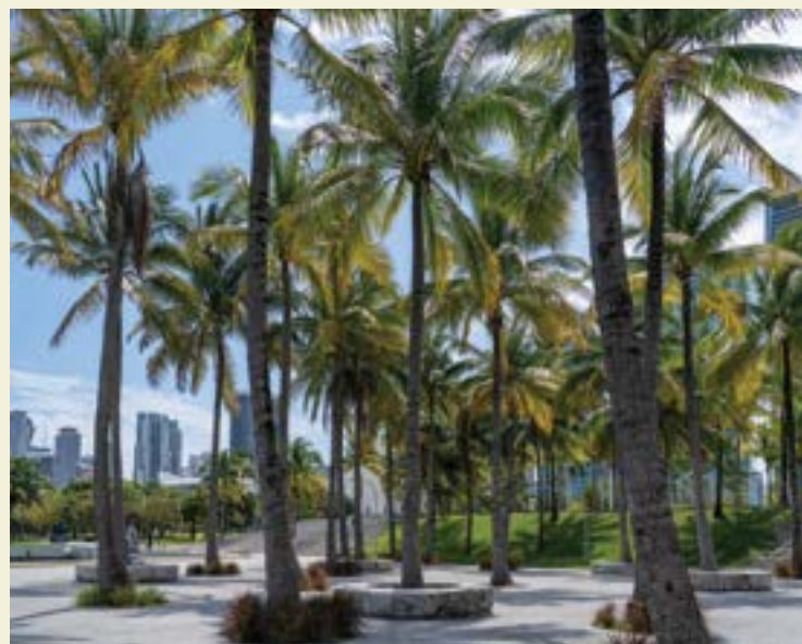
NA PARTE DE CIMA: Miami Beach Golf Club; NO MEIO: South Beach; NA PARTE DE BAIXO: Maurice A. Ferré Park Baywalk