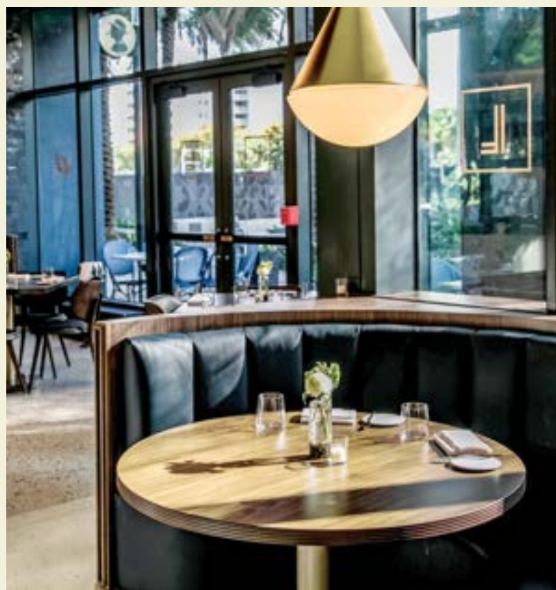
BRASSERIE LAUREL, MIAMI WORLDCENTER

O cenário gastronômico em constante evolução de Miami abrange desde restaurantes locais até restaurantes aclamados, servindo culinárias tão diversas quanto as pessoas que visitam a cidade. Mais de uma dúzia de restaurantes com estrelas Michelin estão bem pertinho da JEM. Quando concluído, o Miami Worldcenter abrigará mais de 30 restaurantes, incluindo vários de chefs de renome mundial