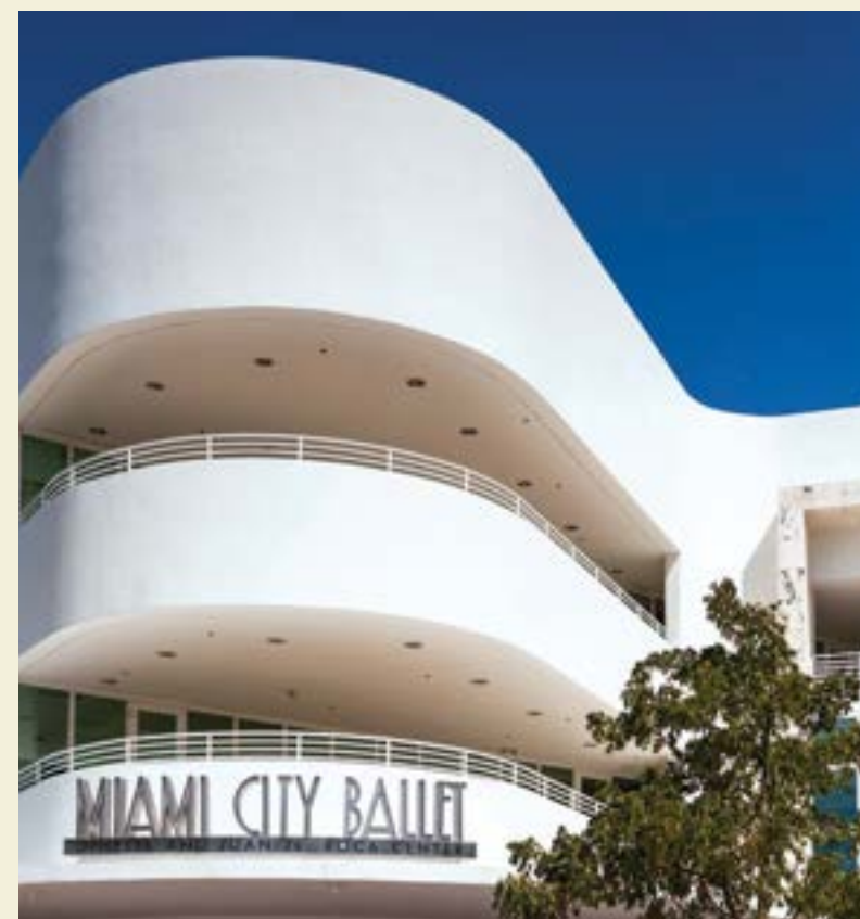
MIAMI CITY BALLET, MIAMI BEACH