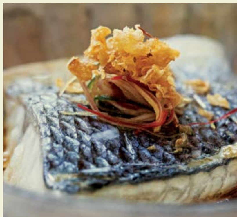
SEXY FISH MIAMI