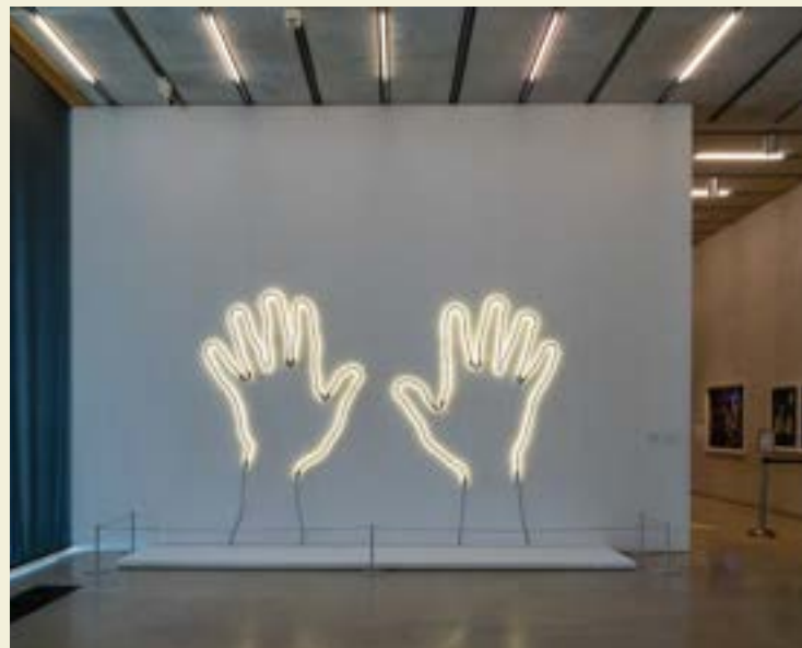
NA PARTE DE CIMA: Wynwood Walls; MEIO: Penetrável Macaléia de Hélio Oiticica no Pérez Art Museum Miami; NA PARTE DE BAIXO: Notes for a Poem on the Third World, Glenn Ligon, Pérez Art Museum Miami