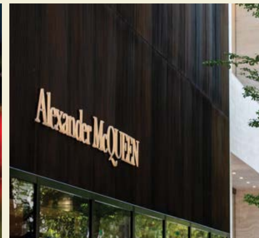
ALEXANDER MCQUEEN, DESIGN DISTRICT