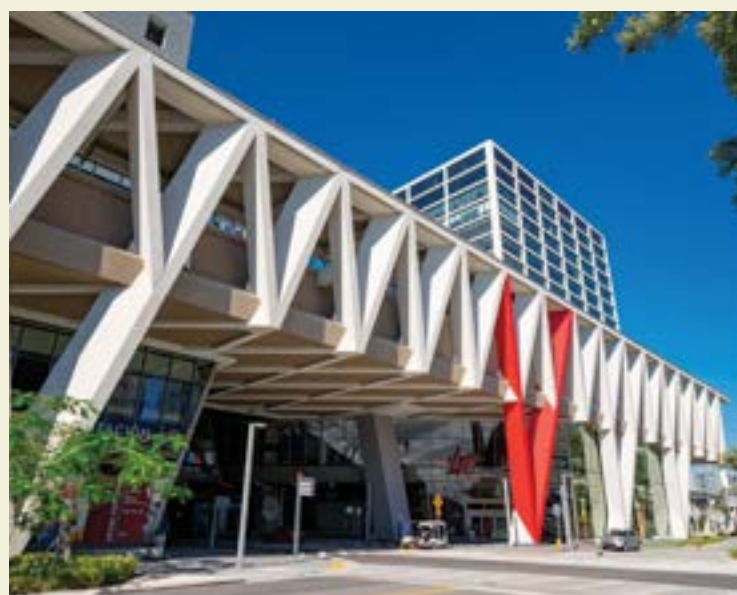
NA PARTE DE CIMA: Miami Metromover; MEIO: Brightline; NA PARTE DE BAIXO: Estação Ferroviária Central de Miami